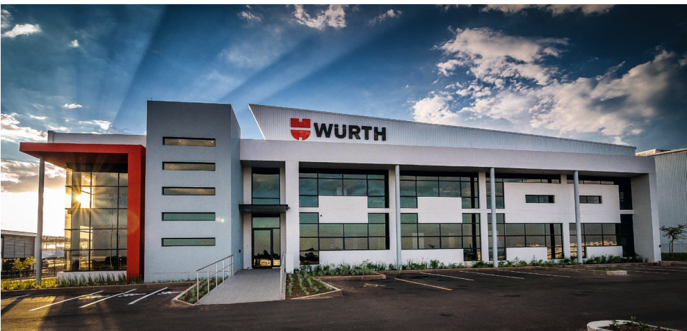
Wuerth South Africa (Pty.) Ltd. à Gauteng, Afrique du Sud

Nous devons notamment faire preuve de vigilance lorsque nous recueillons et traitons des données personnelles. Nous respectons les lois de protection et de confidentialité des données en vigueur et désignons des personnes et services en vue de gérer la conformité.