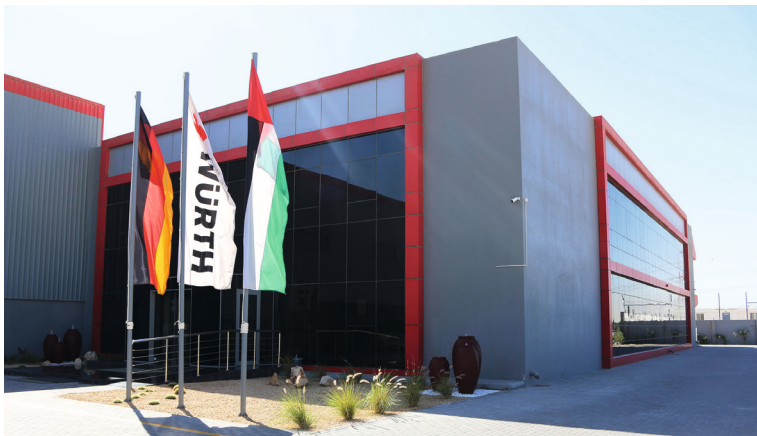
Würth Gulf FZE à Dubaï, Émirats arabes unis

Le Groupe Würth reconnaît que certaines ressources naturelles sont limitées. Par conséquent, nous faisons notre maximum pour les traiter de façon écologiquement responsable. Cela signifie non seulement que nous respectons les lois en vigueur en matière de développement durable et de protection de l'environnement, mais aussi que nous essayons, dans la mesure du possible, de ne pas utiliser de ressources non renouvelables non indispensables. Chaque collaborateur est donc encouragé à mettre en œuvre des mesures pratiques visant à réduire le gaspillage de ressources et à éviter de générer de la pollution.