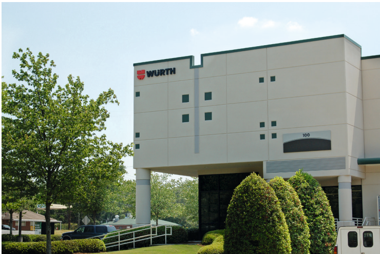
Würth Wood Group Inc. à Charlotte, USA

Ceci exclut les conférences, les travaux littéraires occasionnels et toute autre activité comparable. Nous sommes toujours heureux d'apprendre que nos collaborateurs s'engagent dans le bénévolat.