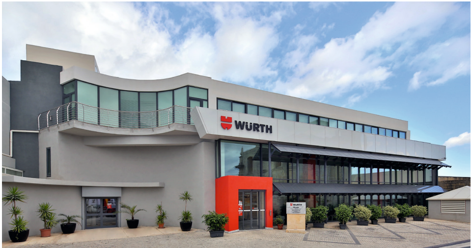
Würth Limited à Zebbug, Malte

Nous sommes conscients que ceci ne s'applique pas simplement aux biens matériels mais également aux informations et technologies qui, de la même manière, ne peuvent arriver de manière illégale entre les mains de tiers. Toute violation peut occasionner un sérieux préjudice pour le Groupe Würth. Tous les collaborateurs sont donc invités à faire preuve de prudence et, par exemple, à ne pas transmettre d'informations de manière illicite par e-mail ou téléphone. En cas de doute ou de question, nos employés peuvent (et doivent) se rapprocher de leurs responsables ou des services compétents.